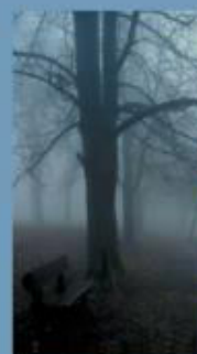
A Magyar Katolikus Püspöki Konferencia körlevele a teremtett világ védelméről